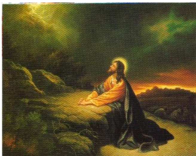
Lendvay Katalin: Jézus a pusztában

"Erőt kértem az Úrtól, és Ő nehézséget adott, melyben megedződtem. Bölcsességért imádkoztam, és Ő problémákat adott, melyeket megtanultam megoldani. Előmenetelt óhajtottam: gondolkodó agyat és testi erőt kaptam, hogy dolgozzam. Boldogságot kértem, és Isten veszélyeket adott, melyeket legyőztem. Szeretetre vágytam, és kaptam az Úrtól bajba jutott gyerekeket, hogy segítsék rajtuk."